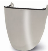
WV100003 VISOR FULL FACE