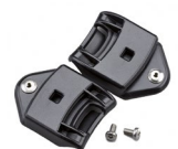
WAC00003 BAJONETTEVERSCHLUSS FUER GEOHRSCHUTZMUSCHELN