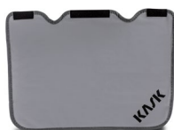
WAC00020 PLASMA NACKENSCHUTZ