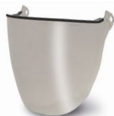
WV100003 VISOR FULL FACE