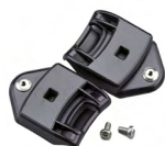
WAC00003 BAJONETTEVERSCHLUSS FUER GEOERSCHUTZMUSCHELN