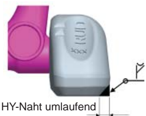
Abb. 3: HY-Naht